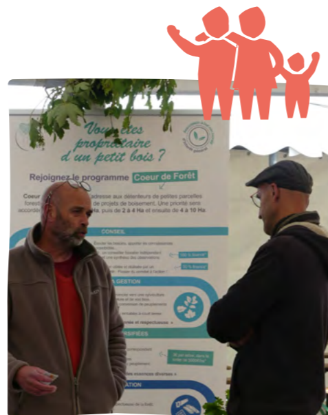
STAND CŒUR DE FORÊT DURANT L'ÉVÉNEMENT APIFOLIE

Une formation au bûcheronnage, en collaboration avec le CRPF 46, a permis à 12 participants de gagner en autonomie dans la gestion de leurs parcelles . Cette initiative illustre notre engagement à éduquer et à transmettre des compétences clés pour une exploitation forestière durable.