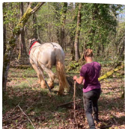
DÉBARDAGE À CHEVAL CHEZ UN PROPRIÉTAIRE EN BOURIANE

En 2023, nous avons continué à tisser des liens solides avec les acteurs locaux . Nous agissons ainsi à la faveur des circuits courts forestiers et de la gestion durable des bois sur plusieurs générations dans le Sud-Ouest de la France.