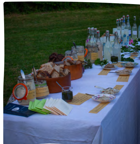
DÉGUSTATION DE PESTO CUISINÉ AVEC DES HERBES FORESTIÈRES DURANT LA NUIT DES FORÊTS

Notre collaboration étroite avec les CRPF, la Chambre d'Agriculture du Lot, le PNR des Causses du Quercy, les Pôles d'Équilibre Territorial et Rural (PETR) du Lot ou encore l'association Campagnes Vivantes 82 ou l'association Cahors Juin Jardin, mais aussi les rencontres avec SOS Forêt Dordogne, le coin des scieurs, Périgord pistage, les groupes locaux du RAF ... soulignent notre volonté de créer des synergies territoriales pour une gestion durable des forêts . Cette approche collaborative est essentielle pour renforcer notre impact et notre crédibilité dans le secteur.