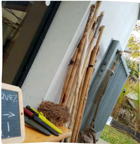
FABRICATION DE BÂTON DURANT LA FÊTE DE L'ARBRE À DROUELLE

Nous avons marqué les esprits d'environ 3000 personnes en participant à 17 événements sur le territoire. Ces moments de partage, riches en enseignements, renforcent notre mission de sensibilisation à l'importance d'une gestion forestière respectueuse . Notre participation à des foires ou des fêtes de village nous permet de faire connaître nos actions et d'apporter des réponses aux visiteurs. Environ 50 contacts sur les 126 sollicitations l'an passé sont issus de ces événements. Notre implication dans la co-organisation des événements des « Chemin du bois », du « Festival des scieurs et de la forêt », de la « Nuit des forêts », et de l'animation « Nature peinture » ont aussi été des temps précieux pour