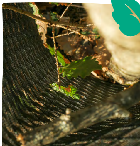
SUIVI DE PLANTS EN RÉGÉNÉRATION NATURELLE ASSISTÉE

Dans le Tarn et Garonne, trois propriétaires se sont lancés avec nous dans l'aventure de la Régénération Naturelle Assistée . Cette démarche, nouvelle pour nous dans cette région, montre combien les contextes et les dynamiques de végétation peuvent varier d'un département à l'autre. Nous avons découvert ensemble l'importance de s'adapter à chaque écosystème pour mieux le régénérer .