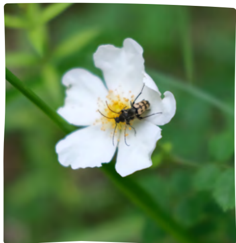
LES INSECTES PROFITENT DES FLEURS DE FRAISES DES BOIS